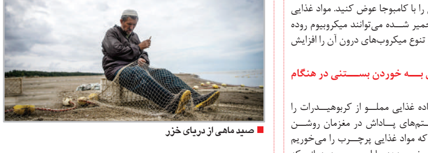
صید ماهی از دریای خزر