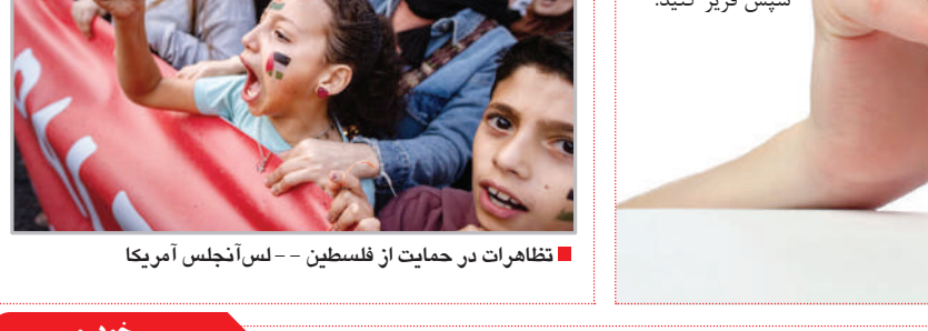
تظاهرات در حمایت از فلسطین -- لس‌آنجلس آمریکا