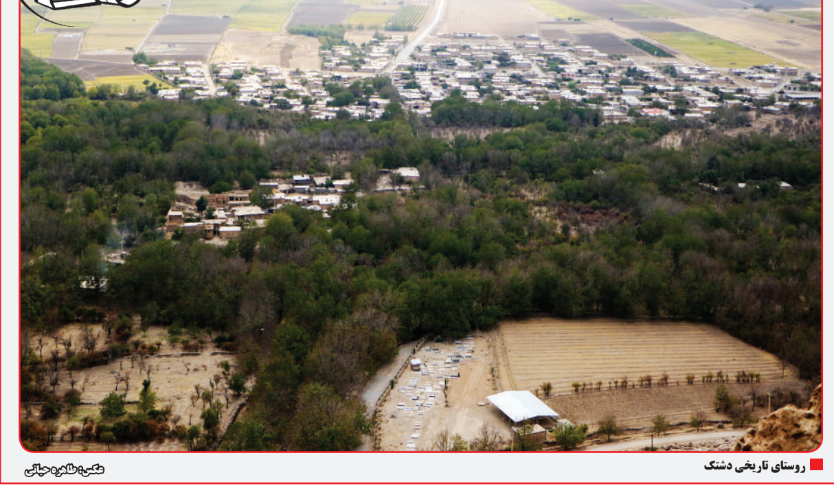
روستای تاریخی دشتک