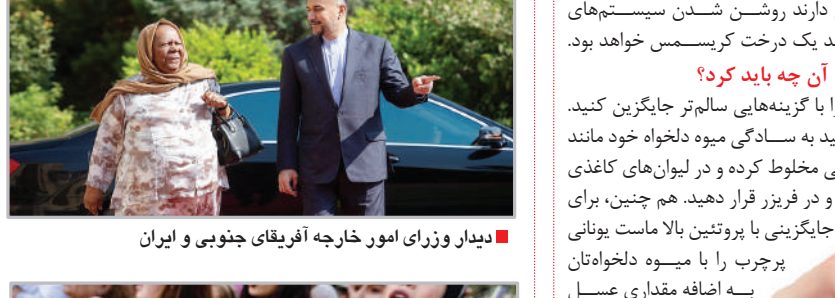
دیدار وزرای امور خارجه آفریقای جنوبی و ایران