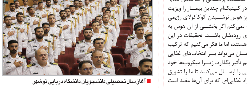
آغاز سال تحصیلی دانشجویان دانشگاه دریایی نوشهر