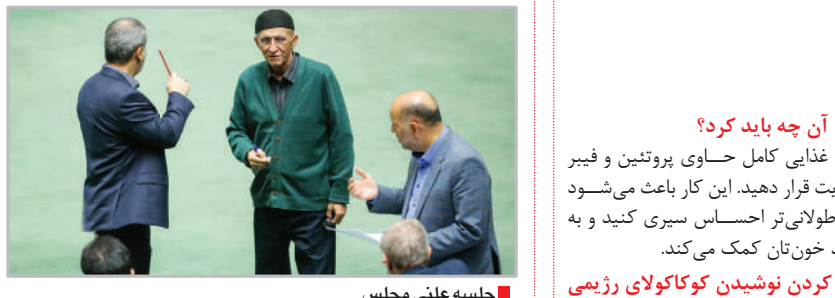
جلسه علنی مجلس