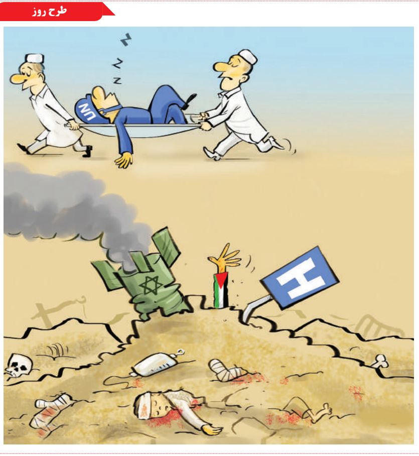
خواب عمیق سازمان ملل

شرکت سونا نانوتک معتقد است که نانومیله‌های طلای این شرکت می‌تواند درمان سرطان را متحول کند. این نانومیله‌های طلا از زیست‌سازگاری برخوردار بوده و می‌تواند با ویژگی‌های منحصر به فردی که دارد به توسعه روش‌های درمانی جدید کمک شایسته‌ای نماید. طی چند سال گذشته، سونا نانوتک تلاش کرده تا فناوری نانوذرات زیست سازگار خود را برای استفاده در درمان هدفمند سرطان توسعه داده و عملیاتی کند. این شرکت همچنین در حال توسعه یک روش هدفمند درمان سرطان است و از درمان هایپرترمی هدفمند خود برای هدف قرار دادن مستقیم سلول‌های سرطانی استفاده کند.