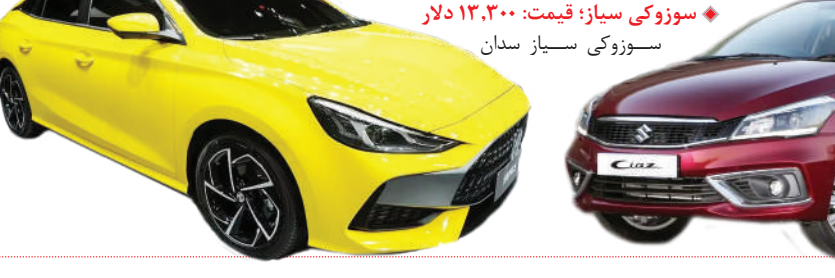
سوزوکی سباز: قیمت: ۱۲،۳۰۰ دلار

کیفی محصولات مناسب بوده و در بازار اروپا نیز فروش خوبی دارد. این برند بریتانیایی سابق، در چین سدان‌های جنایی را عرضه می‌کند که کوچک‌ترین آن‌ها MG ۵ است. نسل دوم این خودرو در نمایشگاه کن ۲۰۲۰ با زبان طراحی جدید و جذاب ام‌جی معرفی شد. MG ۵ با پیشران‌های ۱/۵ لیتری تنفس طبیعی و توربو به بازار عرضه می‌شود که اولی ۱۲۹ اسب بخار قدرت و ۱۵۸ نیوتن متر گشتاور دارد و با گیربکس‌های دستی و CVT ارائه می‌شود. هرچند این مدل از لحاظ مشخصات کاملاً با شاهین اتوماتیک قابل‌مقایسه است اما قیمت آن از تنها ۶۷،۹۰۰ یوان معادل ۹،۳۰۰ دلار آغاز می‌شود که بسیار از شاهین ارزان‌تر است. به همین دلیل، سراز نسخه توربو با ۱۸۰ اسب بخار قدرت و ۲۸۵ نیوتن متر گشتاور می‌رویم که با گیربکس ۷ سرعته دوکلاجه و قیمت پایه ۹۲،۹۰۰ یوان معادل ۱۲،۷۰۰ دلار عرضه می‌شود و قطعاً شاهین را تار و مار می‌کند.